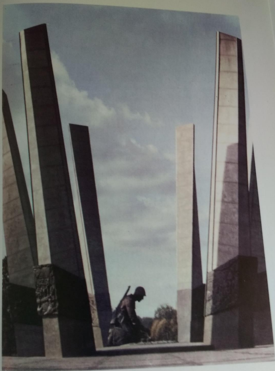
POMNIK CHWAŁA SAPEROM W WARSZAWIE